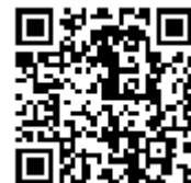
集合場所地図表示用 QRコード